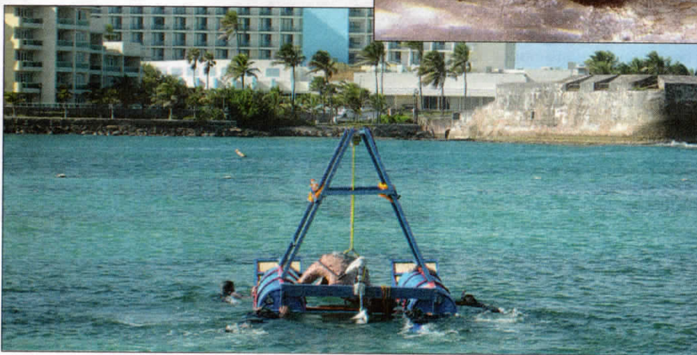
Las piezas a depositarse en lugares distantes son llevadas con una barcaza casera

se distinguen por ser un producto de aquí, sino que son el resultado de mucha creatividad. Le invitamos a descubrir sus interesantes formaciones.