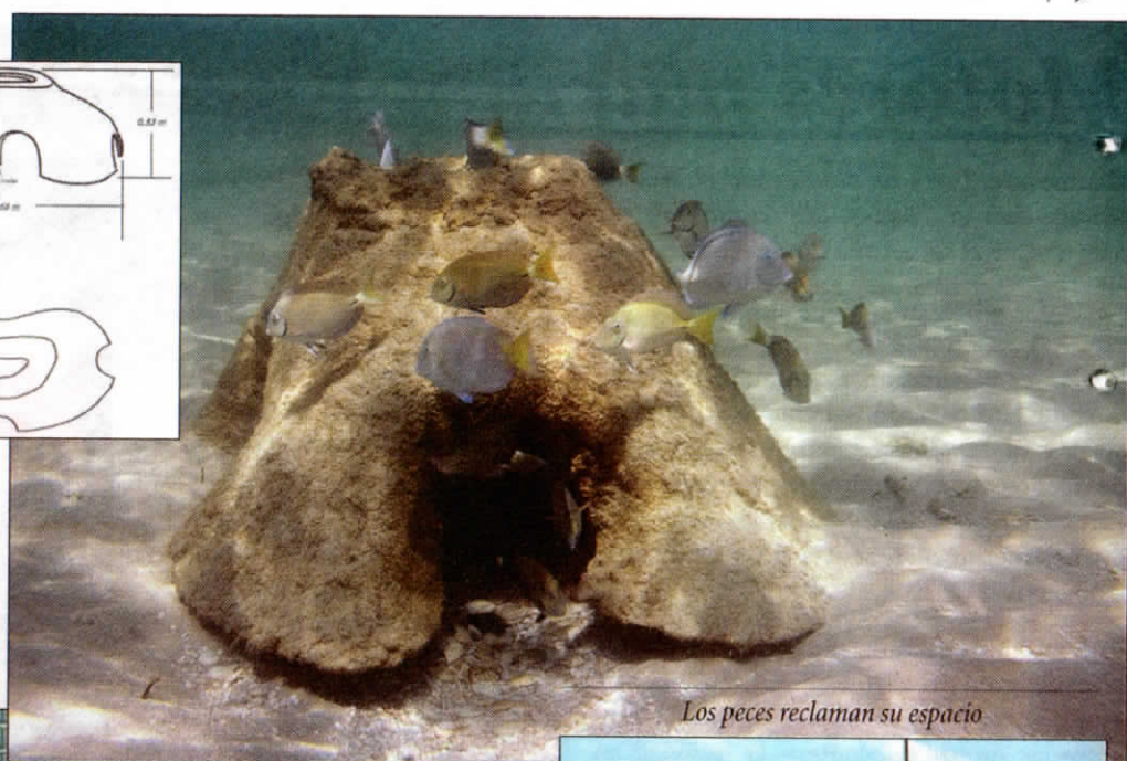
Los peces reclaman su espacio